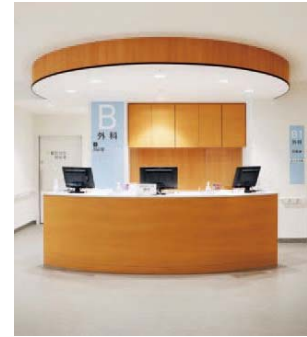
1階 外科・整形外科受付