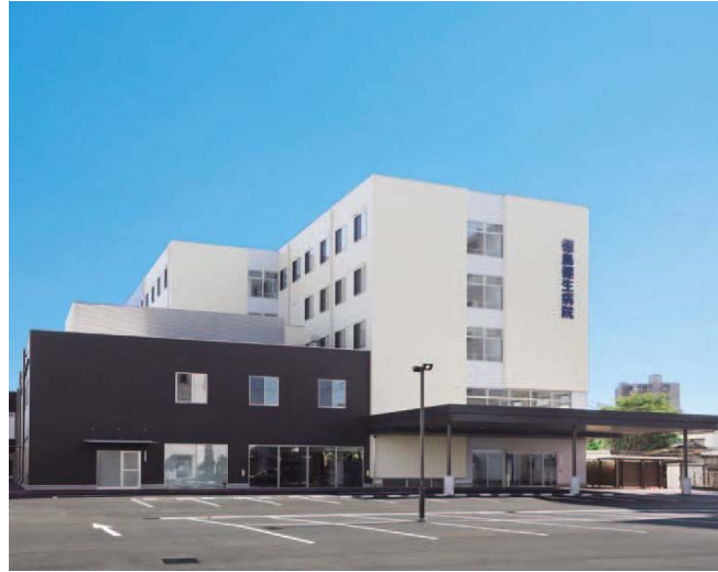
外観 北西側より見る

徳島健康生活協同組合 徳島健生病院 新病院建設事業 徳島県徳島市 20年10月竣工 施主 徳島健康生活協同組合 施工 株式会社 合田工務店 鉄骨造地上5階建