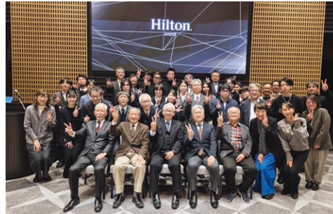
協力事務所の皆さんとの2025年忘年会にて

10年前に竣工した事務所ビルの増築工事です。少人数で利用できる会議室、倉庫、職員の休憩やイベントに利用できるフリースペースなど、現状不足している機能を盛り込んだプランになっています。既存棟とは2、3階でつながり、1階は既存棟から一旦外に出てアクセスする離れのような場所になっています。 (富永・伊達)